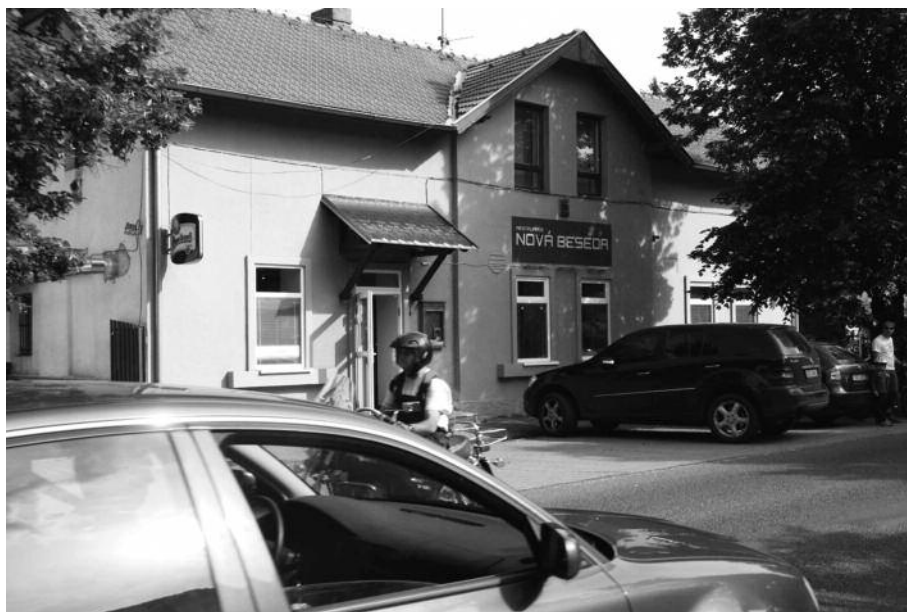
Restaurace Nová Beseda

Děkujeme Městské části Praha-Klánovice za pomoc a finanční podporu koncertů a divadelních představení pro děti i dospělé.