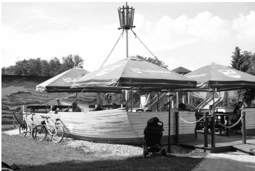
Restaurace Samos, foto: R. Kůla