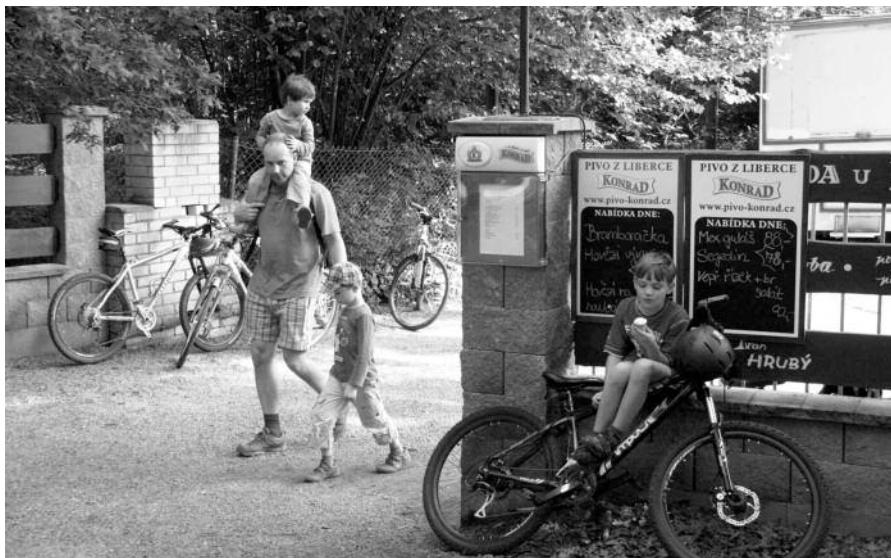
Hospoda u lesa