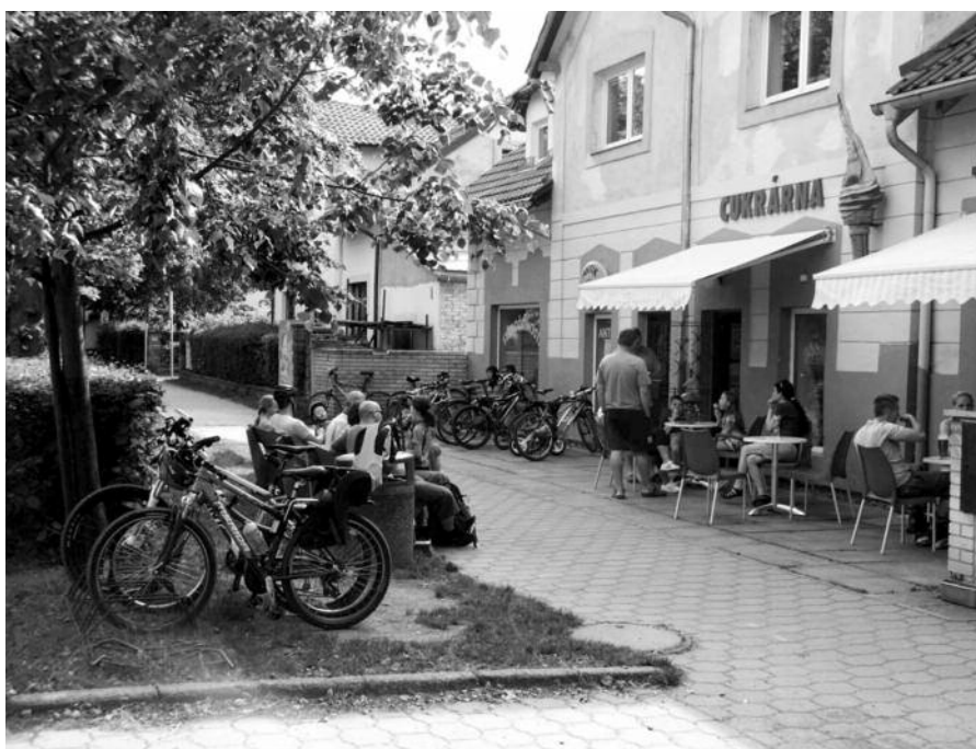
cukrárna Juniorm