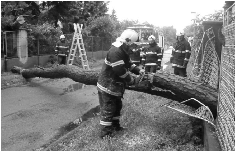
Zásah hasičů při povodních

Jak již se stalo tradicí, pořádá Sbor dobrovolných hasičů Klánovice ZÁBAVNÉ ODPOLEDNE S HASIČI , které se koná v sobotu dne 21. září 2013 od 14.00 hodin v okolí Haly starosty Hanzala . Na co se můžete těšit: výstava hasičské techniky, skákací hrad, soutěže pro děti a jejich doprovod, ukázka činnosti psůvodů, dopravní hřiště apod. Akci finančně podpořil Úřad Městské části Praha – Klánovice.