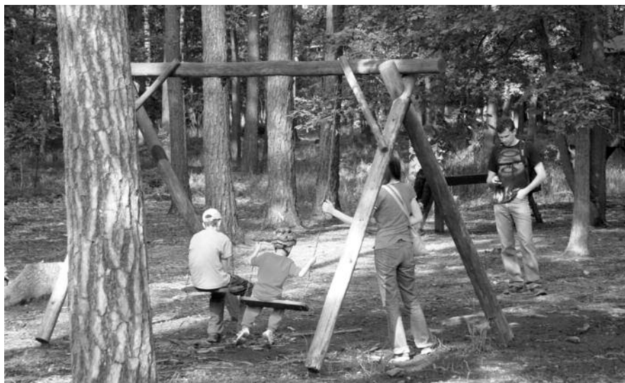
Lesní hřiště na cestě do Úval

Naučná stezka popisuje historii Klánovického lesa, jeho faunu a floru, zaniklé vesnice na území lesa (Slavětice, Hol, Žáky, Lhotu nad Úvalem) a historii okolního osídlení (Jirny, Šestajovice, Újezd nad Lesy a Úvaly). Naučná stezka byla vybudována v roce 1995 s 10 zastávkami. Počet zastávek jsme postupně zvyšovali až na současných 17, kdy zastávka č. 15 je dětské sportoviště. Protože jsme nové zastávky umísťovali mezi stáva-