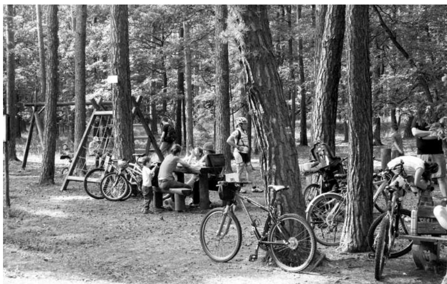
STOPA, foto: R. Kůla